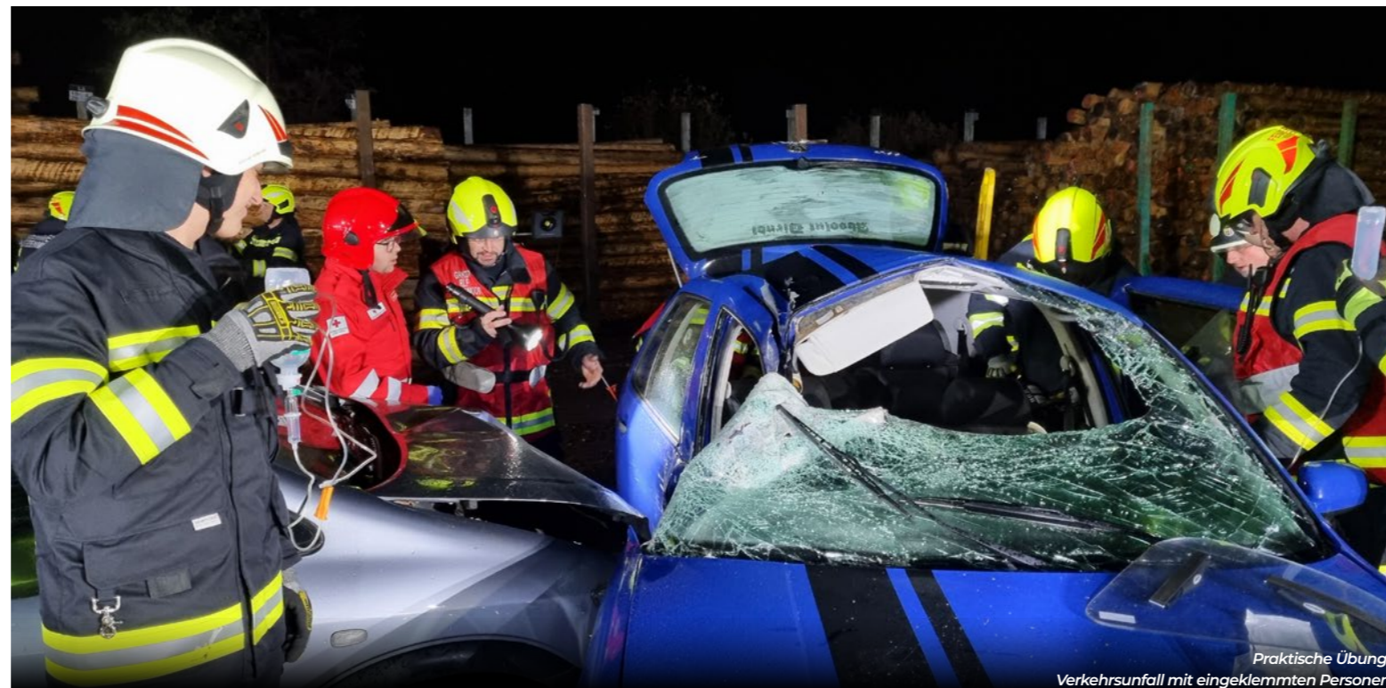
Praktische Übung: Verkehrsunfall mit eingeklemmten Personen