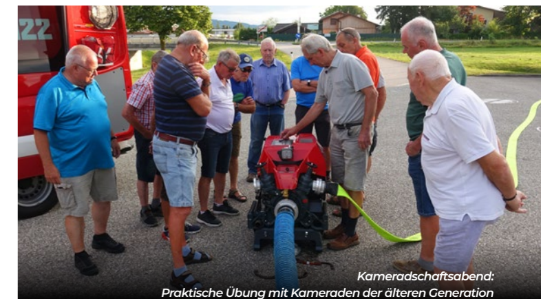
Kameradschaftsabend: Praktische Übung mit Kameraden der älteren Generation