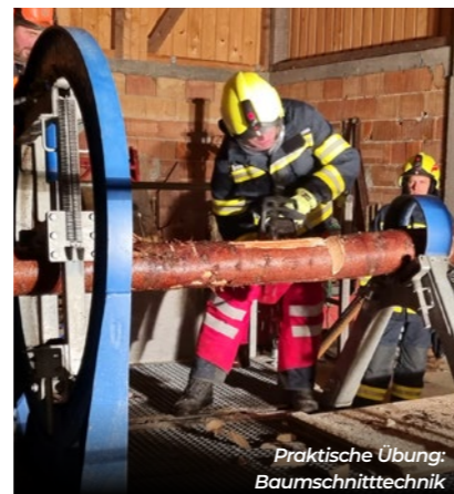
Praktische Übung: Baumschnitttechnik