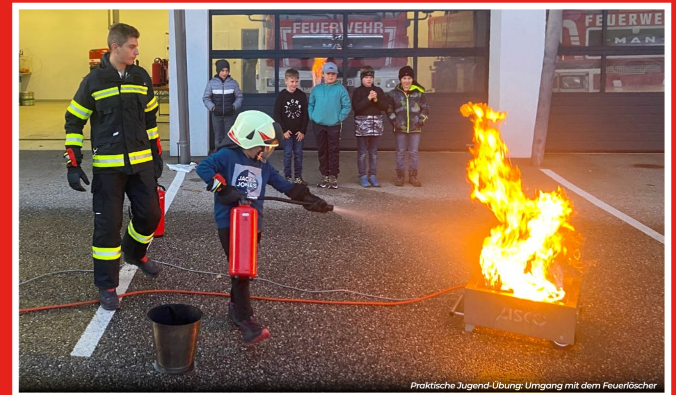
Praktische Jugend-Übung: Umgang mit dem Feuerlöscher