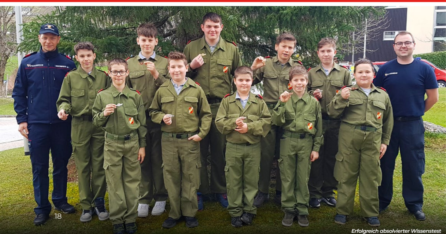
Erfolgreich absolvierter Wissenstest

Wir danken der Eigentümerfamilie der Liegenschaft für die Benutzung des Areals.