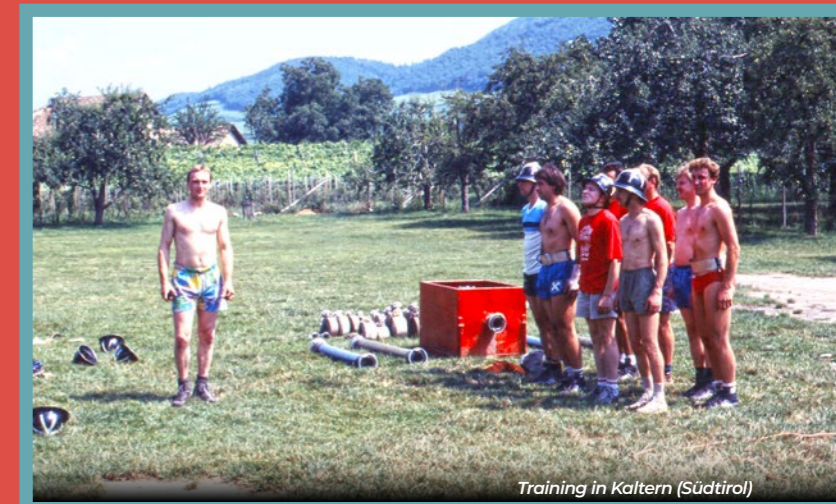
Training in Kaltern (Südtirol)

Wir bedanken uns bei jedem einzelnen Mitglied der Bewerbungsgruppe 4 für die 49-jährige Prägung der Geschichte der Freiwilligen Feuerwehr Rutzenmoos.