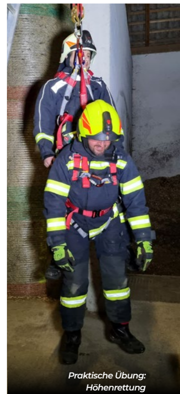
Praktische Übung: Höhenrettung