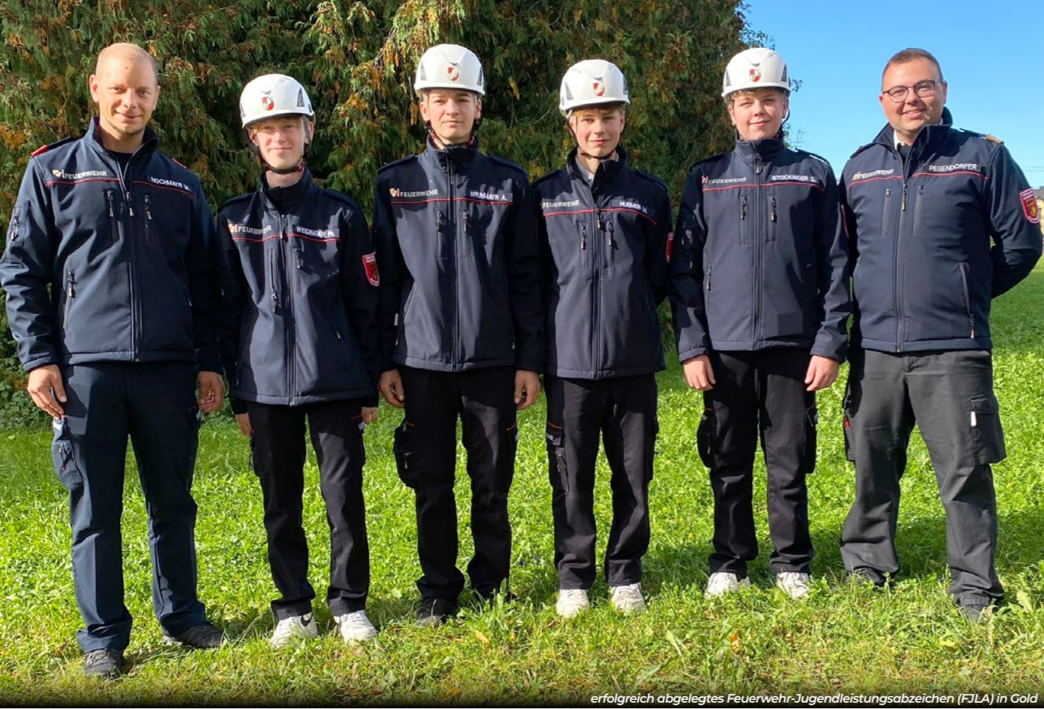
erfolgreich abgelegtes Feuerwehr-Jugendleistungsabzeichen (FJLA) in Gold