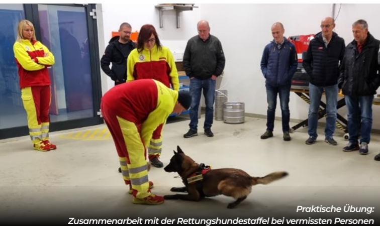
Praktische Übung: Zusammenarbeit mit der Rettungshundestaffel bei vermissten Personen