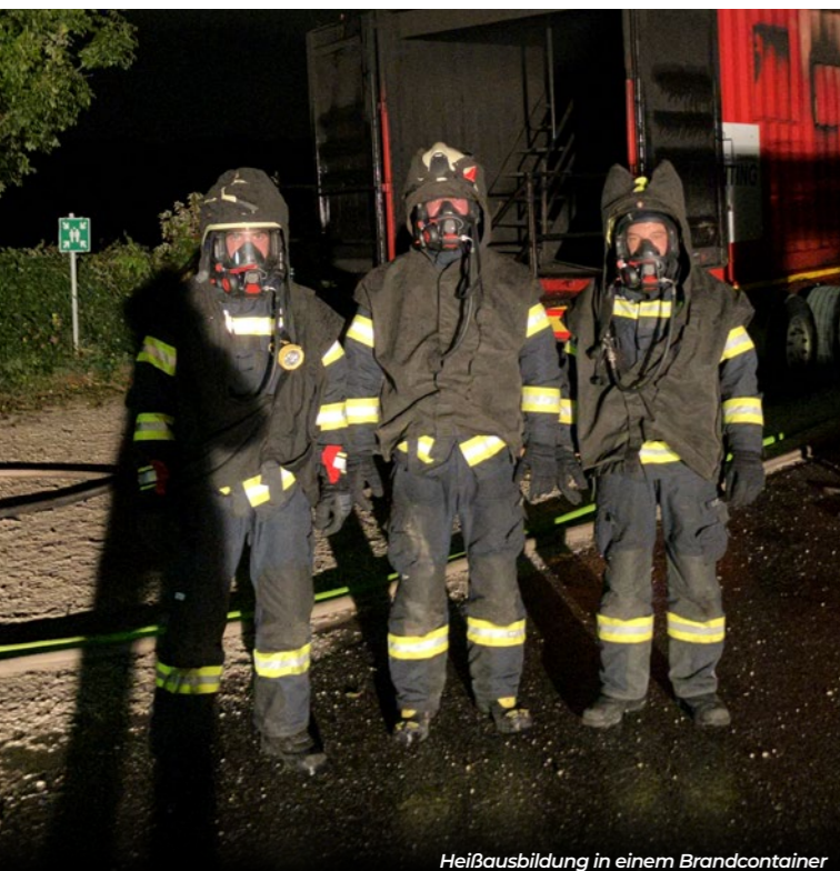
Heißausbildung in einem Brandcontainer