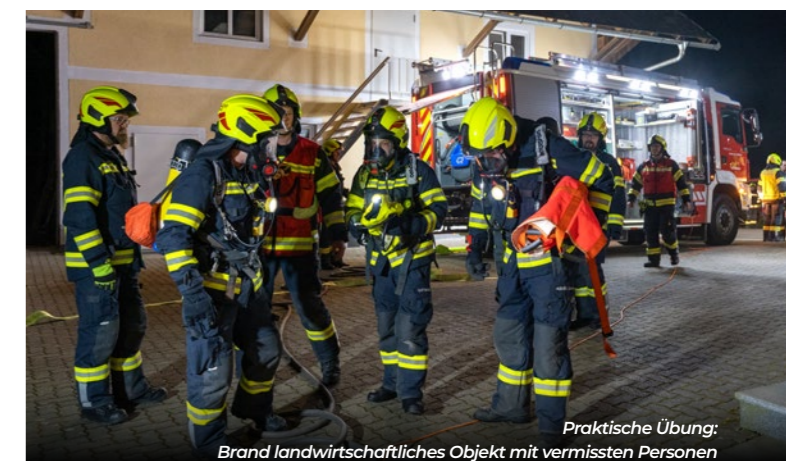
Praktische Übung: Brand landwirtschaftliches Objekt mit vermissten Personen