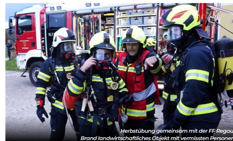
Herbstübung gemeinsam mit der FF Regau: Brand landwirtschaftliches Objekt mit vermissten Personen