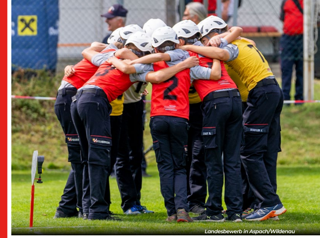
Landesbewerb in Aspach/Wildenau

Anfang April begannen wir mit dem Aufbau unserer Jugendbahn bei der Familie Hauser, wo wir uns in den darauffolgenden Wochen für die Bewerbe im Bezirk vorbereiten konnten. Mit viel Disziplin und Ehrgeiz konnten sich die Jugendmitglieder Sicherheit und Schnelligkeit aneignen, die beim Bewerb schlussendlich entscheidend sind. Die erbrachten Leistungen sprechen für sich. Bei den fünf Bewerben im Bezirk Vöcklabruck konnte viermal ein Pokal mit nach Hause gebracht werden. Beim Bezirksbewerb wurde sogar der zweite Platz in Silber erreicht. Beim Landesbewerb in Aspach/Wildenau konnten aufgrund einiger kleiner Fehler nicht die erhofften Topplatzierungen erreicht werden. Mit einem 87. Platz in Bronze und einem 120. Platz in Silber ging es in die wohlverdiente Sommerpause.