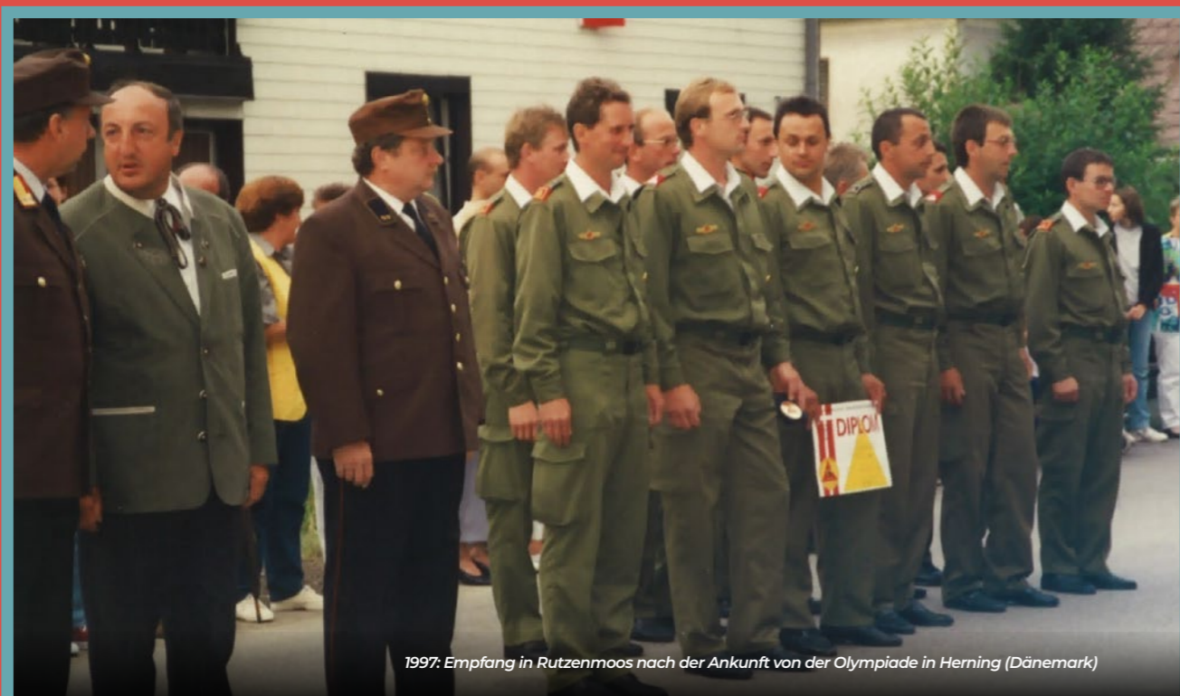
1997: Empfang in Rutzenmoos nach der Ankunft von der Olympiade in Herning (Dänemark)