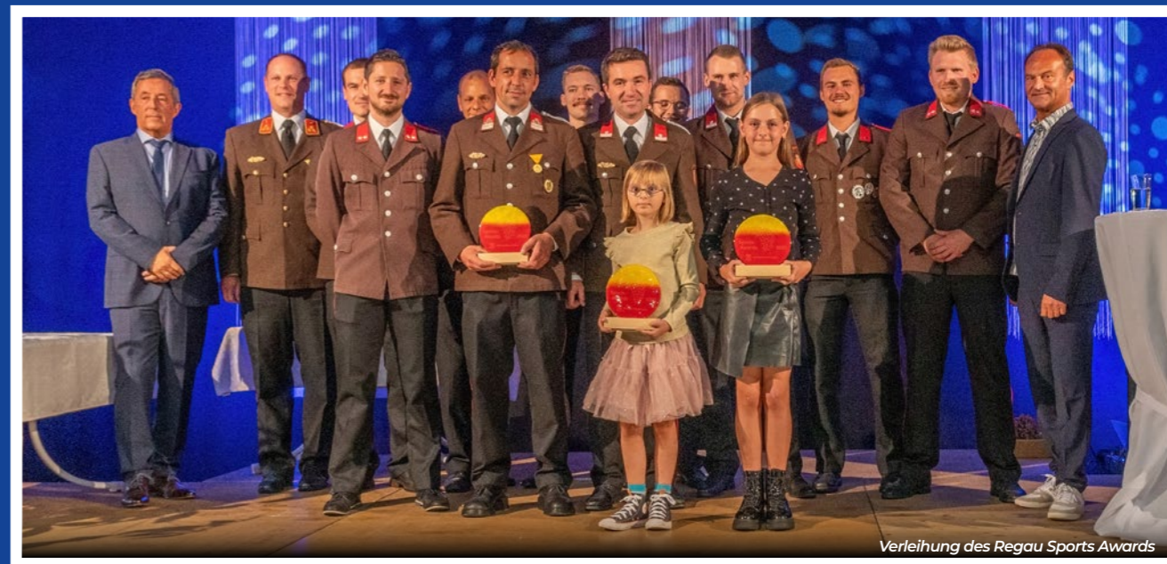
Verleihung des Regau Sports Awards

Beim Landesbewerb wurde dennoch mit einem sehr guten Gefühl gestartet und auch die erhofften Zeiten wurden gelaufen, jedoch kamen wieder unnötige Fehlerpunkte hinzu. In Bronze reichte es mit einer Angriffszeit von 29,3 Sekunden und zehn Fehlerpunkten und einer Zeit im Staffellauf von 50,5 Sekunden und 5 Fehlerpunkten leider nur zum 39. Platz von über 470 angetretenen Gruppen. In der Wertung Silber verhinderten leider ebenfalls zehn Fehlerpunkte bei einer Angriffszeit von 32,9 Sekunden den Landessieg. Schlussendlich wurde hier der 11. Platz erreicht.