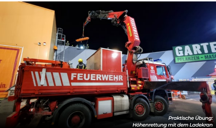
Praktische Übung: Höhenrettung mit dem Ladekran