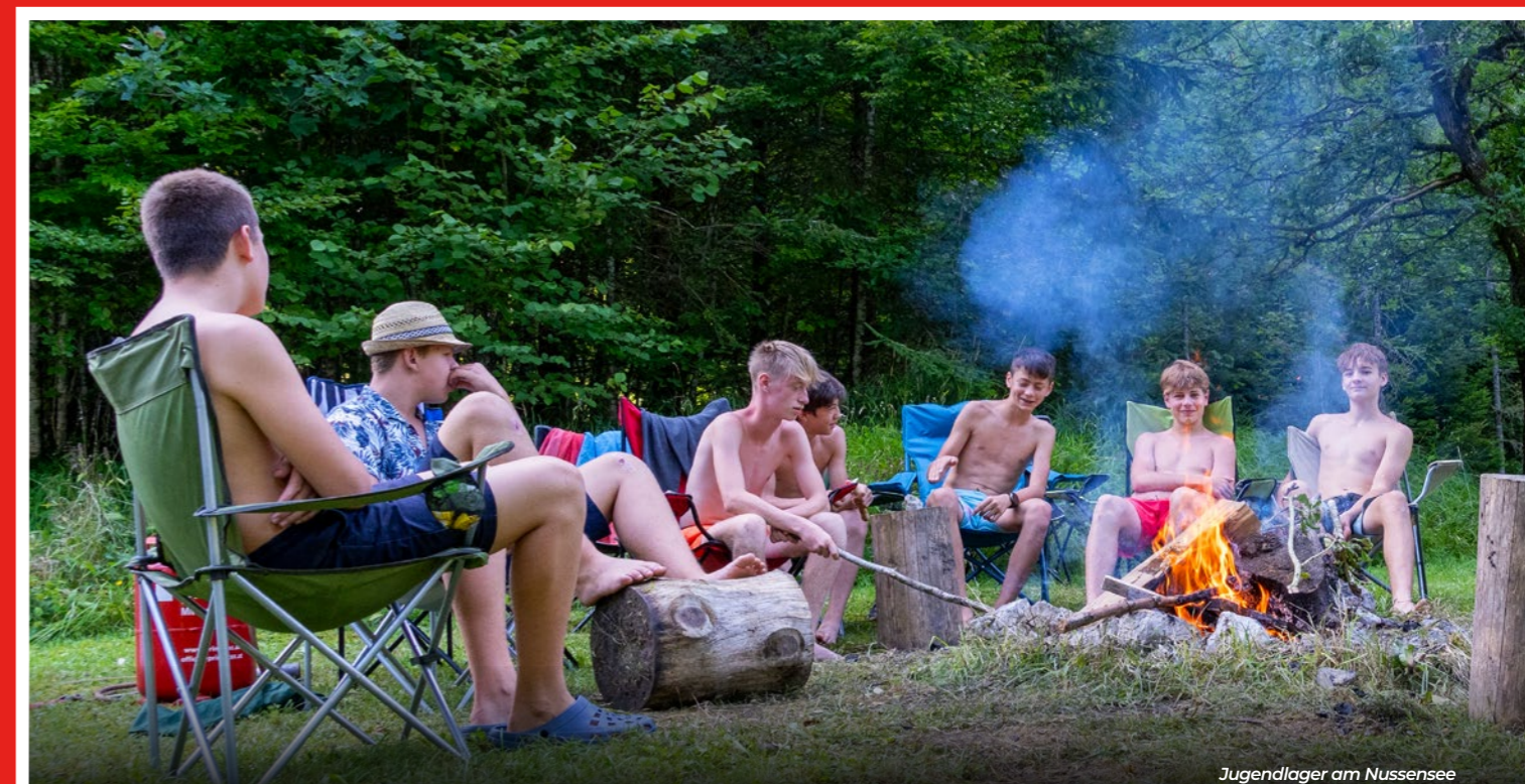
Jugendlager am Nussensee