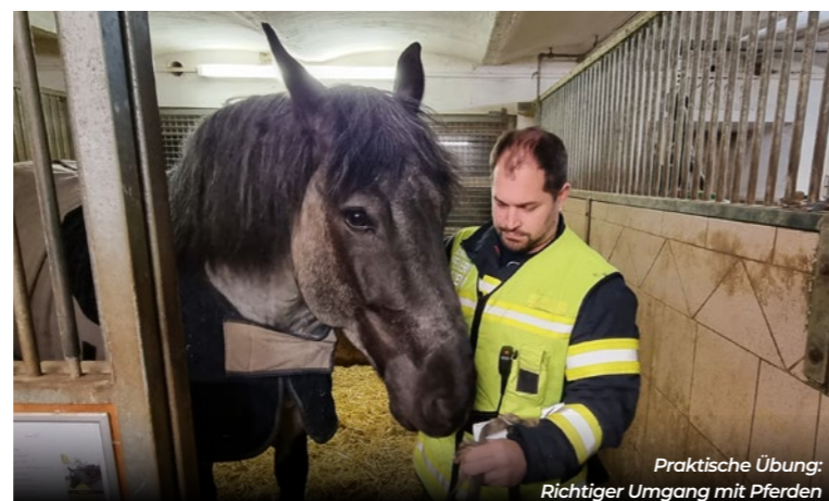
Praktische Übung: Richtiger Umgang mit Pferden