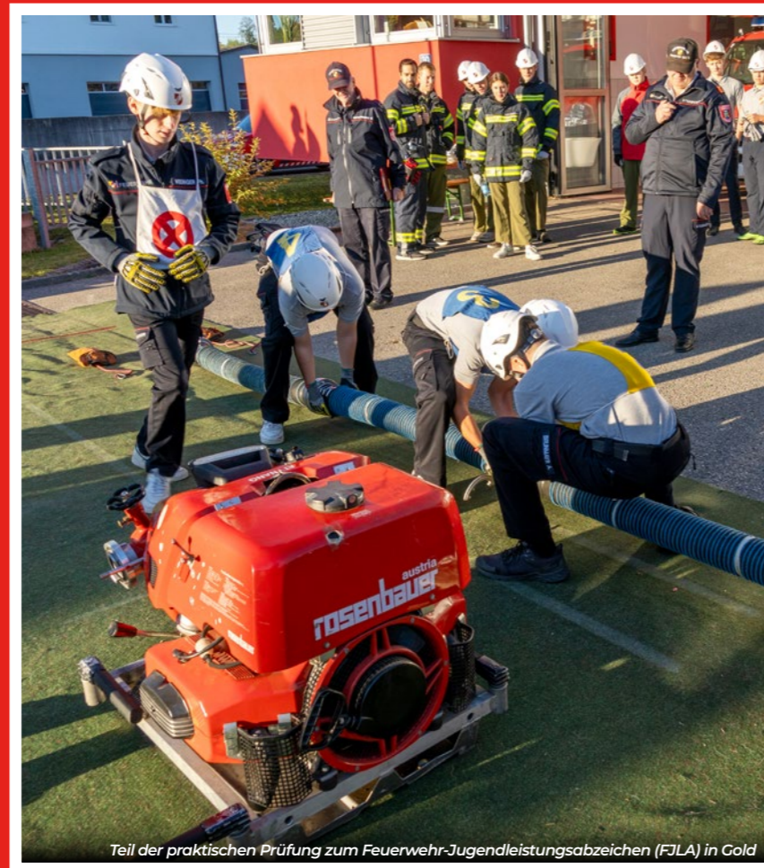
Teil der praktischen Prüfung zum Feuerwehr-Jugendleistungsabzeichen (FJLA) in Gold

Am 1. April fand die alljährliche Flurreinigungsaktion statt, welche vom Ausschuss Hochbau, Ortsentwicklung, Energie und Umwelt der Marktgemeinde Regau organisiert wurde. Viele unserer Jungfeuerwehrmitglieder haben wieder mit viel Freude und voller Tatendrang daran teilgenommen.